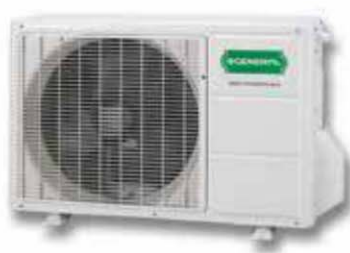
ASG 9 Ui-LT