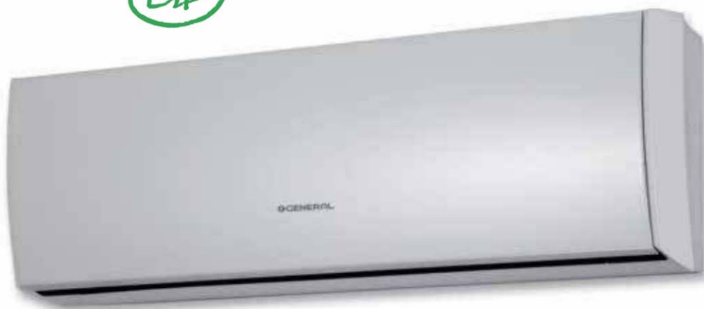
ASG 9/12 Ui-LT