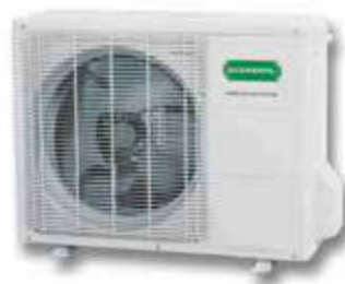
ASG 12 Ui-LT